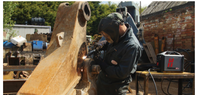
Onderhoud en reparatie