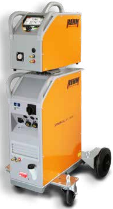
SYNERGIC.ARC 304-504 WS