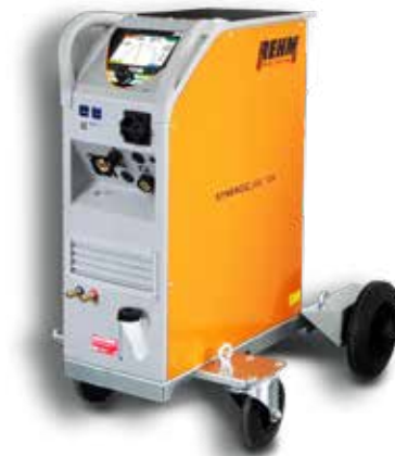
SYNERGIC.ARC 304-504 W